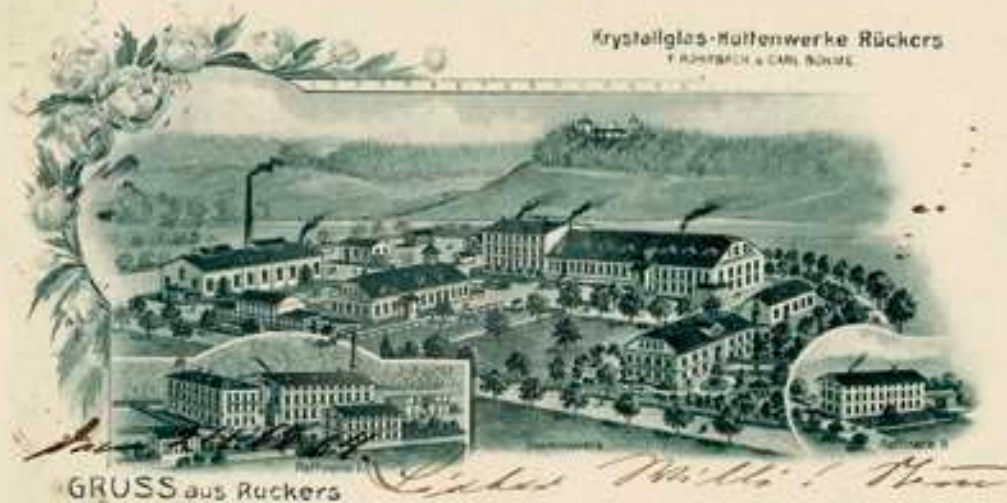
Dawna pocztówka ze Szczytnej.