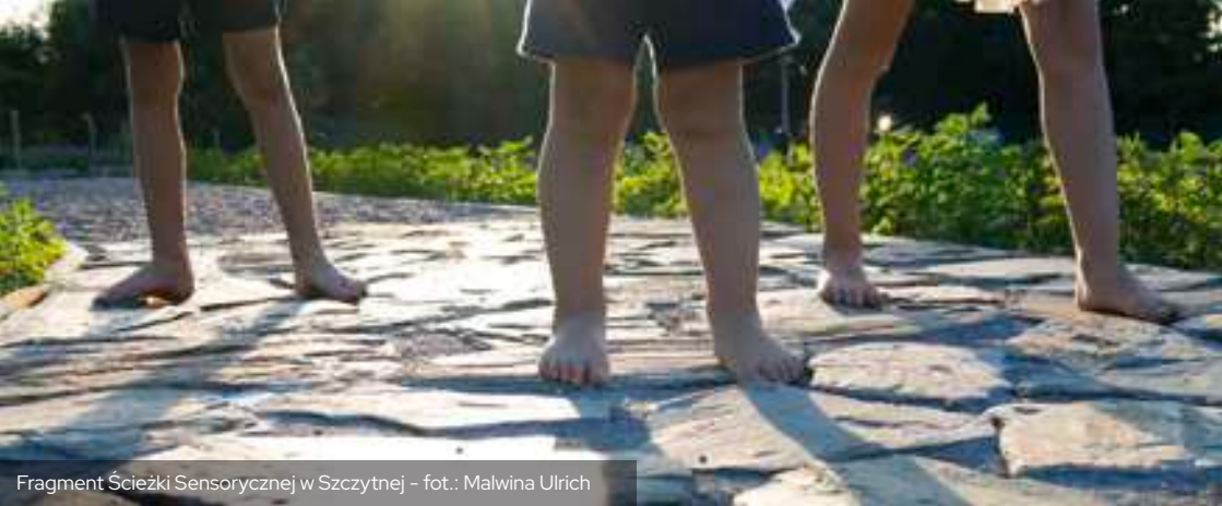
Fragment Ścieżki Sensorycznej w Szczytnej