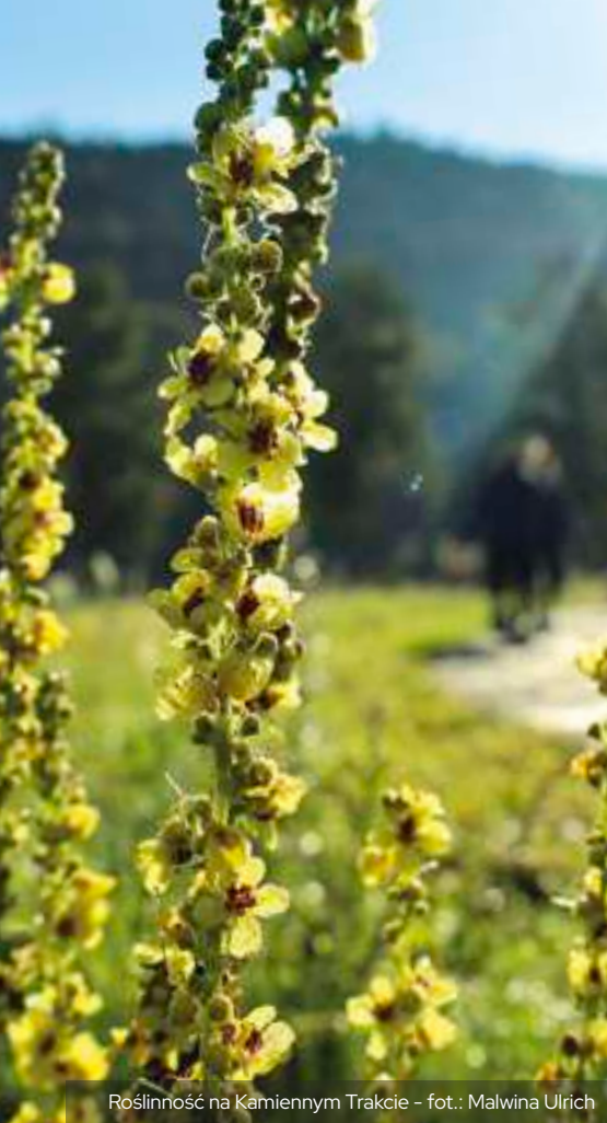
Roślinność na Kamiennym Trakcie – fot.: Malwina Ulrich