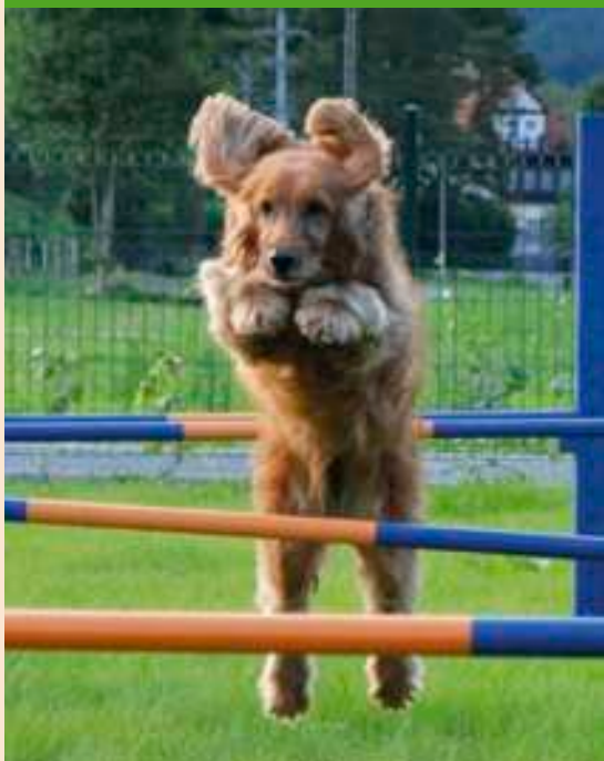
Stacjonata w Psim Parku

Zawsze dopasuj intensywność treningu do możliwości swojego czworonoga.