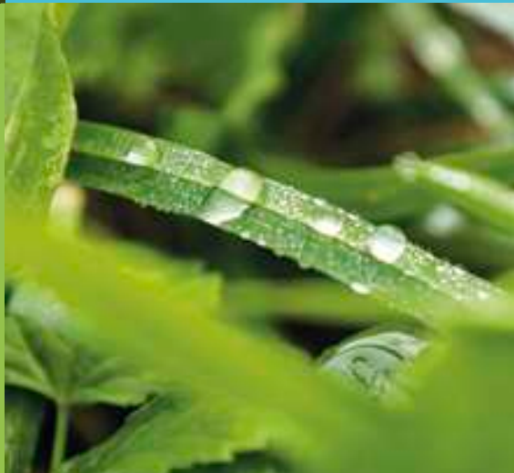
Roślinność na Kamiennym Trakcie

Przechodząc na drugą stronę parku znajdziemy obszerną drewnianą altanę dającą schronienie przed deszczem lub upalnym słońcem. Tuż obok altany znajduje się Psi Park .